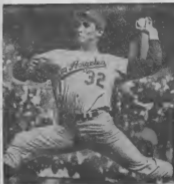
Aki riba Maury Wills, di Los Angeles, ta desliza den e segunda base di Yankee Stadium mientras Bobby Richardson, respaldá pa e torpedero Tony Kubek, ta haci lo posible pa atrapá e bola lanzá pa Joe Pepitone, primera base di Yankees. Ribá e otro grafica por mira e lanzador zardo Sandy Koufax, di Dodgers di Los Angeles, kende a hiba su equipo edilanti den e prome wega di e Serie Mundial di e aña aki.